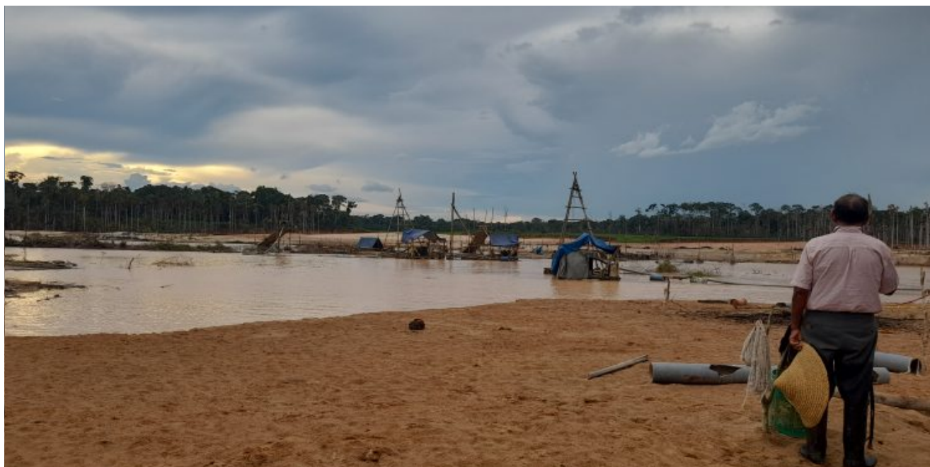
Don Apolinario ve el avance de la minería ilegal en la zona

Los mineros ilegales han destruido su cerco perimétrico, contaminado sus pastizales con relaves de la minería. Además han desaparecido y contaminado una quebrada dentro del potrero que era la fuente de agua para la crianza de 80 cabezas de ganado vacuno. De las más 30 hectáreas de terreno que tenía, desde hace 28 años, ahora solo quedan 15 hectáreas. Los mineros informales, tumban las plantas y árboles maderables para quemarlos y hacer minería dentro de la parcela agrícola. El área está rodeada de actividad minera ilegal; en el lugar no queda más área para el pastoreo de sus ganados.